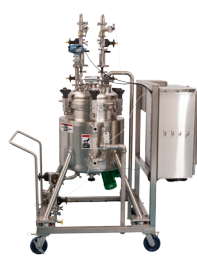
Productos farmacéuticos Recipientes de reactores