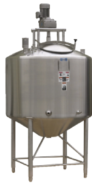
Acero inoxidable Tanques de procesamiento