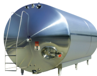
Tanques de almacenamiento